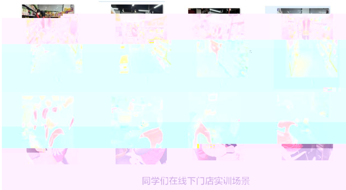
同学们在线下门店实训场景