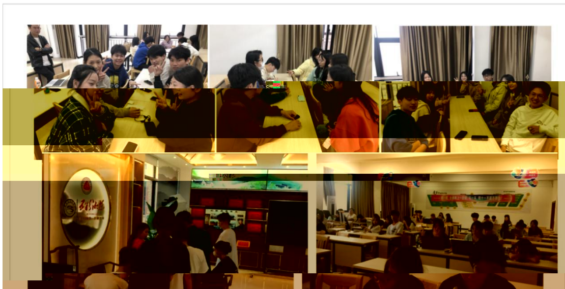
中国实训项目选拔现场